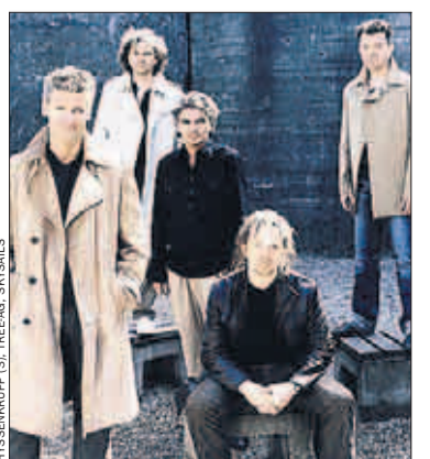
Die Gruppe PUR spielt am 27. Mai in der TUI-Arena. Karten zu gewinnen

Das Duett von ThyssenKrupp und PUR hat Tradition: Bereits seit 2001 liefert der Titel „Abenteuerland“ den Soundtrack zur Imagekampagne des Unternehmens, das viele PUR-Konzerte als Partner begleitet hat.