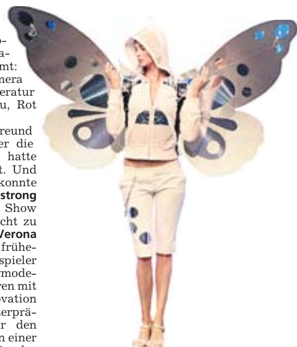
Abstrampeln als Anschauungsunterricht: Günther Jauch und Thomas Gottschalk lassen sich von WDR-Moderator Ranga Yogeshwar erklären, wie viele Kalorien sie pro Trimmradkilometer verbrennen (oben). Schwer hatten's auch die Schülerinnen der Münchener Modeschule: Ihre Kleider sind aus Metall (links).