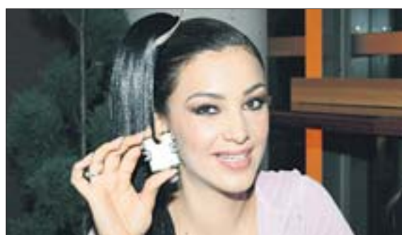
Verona Pooth (38), Showtalent

„Also, das sieht nicht nach einer Steckdose aus. Aber was könnte es sonst sein? Ich weiß es: Ein Zubehörteil für ein Playmobil-Männchen, für einen Taucher. In die Vertiefung hier kommen die kleinen Sauerstoffflaschen, und der Hinweis ‚Wechsel‘ zeigt an, wann sie leer sind.“