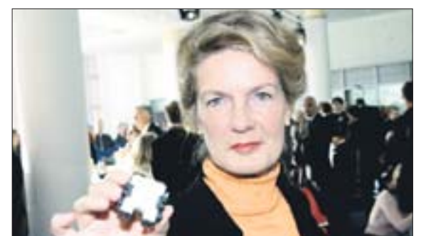
Elisabeth Heister-Neumann (50), Justizministerin

„Das sieht nach einer Sicherung aus. Ist es nicht? Aber es hat bestimmt mit Strom zu tun. Man kann damit offensichtlich einen Stromkreis unterbrechen und wiederherstellen. Das könnte also ein Schalter sein – fragt sich bloß, wo er zum Einsatz kommt. Keine Ahnung.“