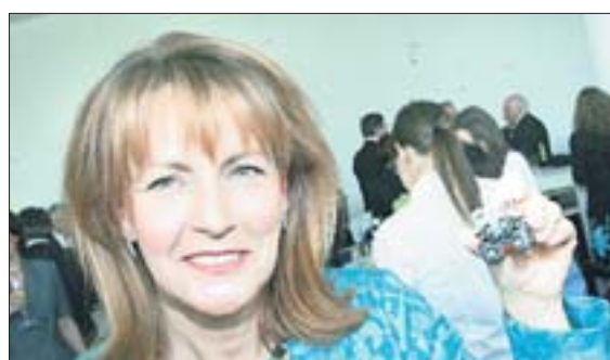
Edelgard Bulmahn (55), ehemalige Bundesforschungsministerin

„Also, das sieht nicht nach einer Steckdose aus. Aber was könnte es sonst sein? Ich weiß es: Ein Zubehörteil für ein Playmobil-Männchen, für einen Taucher. In die Vertiefung hier kommen die kleinen Sauerstoffflaschen, und der Hinweis ‚Wechsel‘ zeigt an, wann sie leer sind.“