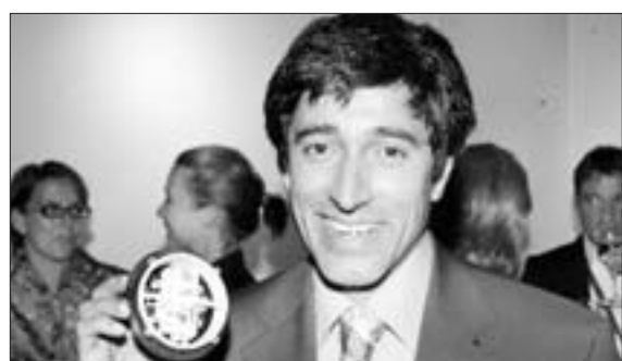
Ranga Yogeshwar (46), Moderator

„Hier ist ein Motor, hier ein Widerstand. Etwas soll damit in unterschiedliche Richtungen verschoben werden. Die Dichtung weist auf einen Schutz vor Wind und Wetter hin. Beim Auto gibt es verstellbare Seitenspiegel – dazu muss das Teil gehören.“