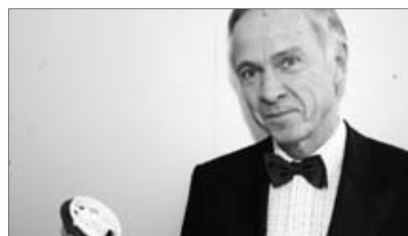
Erich Barke (59), Uni-Präsident

„Hier ist ein Motor, hier ein Widerstand. Etwas soll damit in unterschiedliche Richtungen verschoben werden. Die Dichtung weist auf einen Schutz vor Wind und Wetter hin. Beim Auto gibt es verstellbare Seitenspiegel – dazu muss das Teil gehören.“